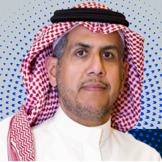
المهندس خالد بن عبدالله الحصان الرئيس التنفيذي لمجموعة تداول السعودية

كما حافظت السوق المالية السعودية على جاذبيتها، مع تنامي مستويات مشاركة المستثمرين المحليين والدوليين الراغبين بالاستفادة من الفرص المتاحة لتحقيق النمو وتنويع المحافظ الاستثمارية. وتواصلت المجموعة تحقيق تقدم ملموس في إطار جهودها لترسيخ مكانة المملكة بين أهم المراكز المالية العالمية، مدفوعة برؤيتها لتحقيق قيمة مستدامة لجميع الشركاء وأصحاب المصلحة.